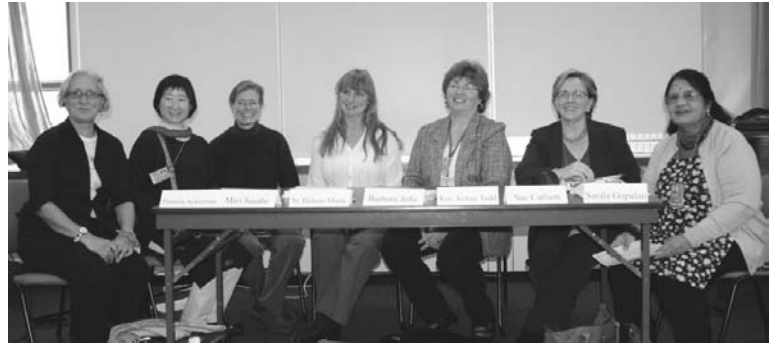
「世界の農業女性円卓会議」にて (左から2人目が筆者)