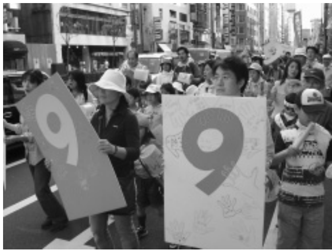
毎年、憲法記念日には「輝け9条 生かそう憲法」をテーマに、5・3憲法集会&パレード(主催:5・3憲法集会実行委員会)が日比谷公会堂で開催され、日本YWCAも参加している。今年も5月3日(日)午後、落合恵子さん(作家)や益川敏英さん(京都産業大学教授・ノーベル物理学賞受賞者)をスピーカーに迎え集会を実施、その後、銀座パレードを予定している。写真は2007年集会。