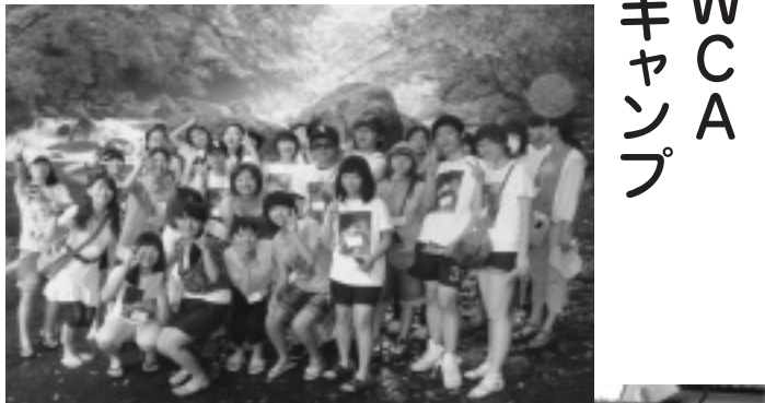
2009年8月 熊本県菊池溪谷