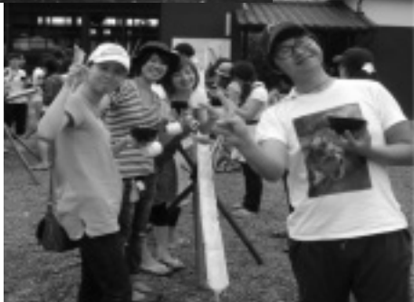
流しソーメンは、竹を切りだすところからやりました

ました。一方、文化史・精神的な意味からも、自分の中の「遅れたアジア」・「忌むべき過去」を否定して近代人として再出発するために、当時の日本人にはどうしても朝鮮をマイナスイメージとして浮かび上がらせ、それを否定し、攻撃し、なきものとする必要があったのではないのでしょうか。